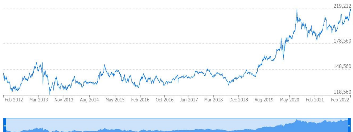
10年間の金価格の推移 (Gold Ounce, XAU to JPY)

我々は、今後、その他貴金属、商品先物、株式、土地、競走馬をはじめ、あらゆる財産的価値のあるものをアプリ「Exchangers」で保管・交換できるサービスを提供することで、金融界のAmazonを目指す。