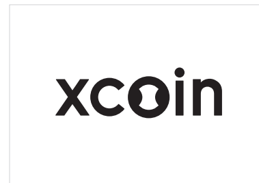
■ モノクロ／背景：白または薄色